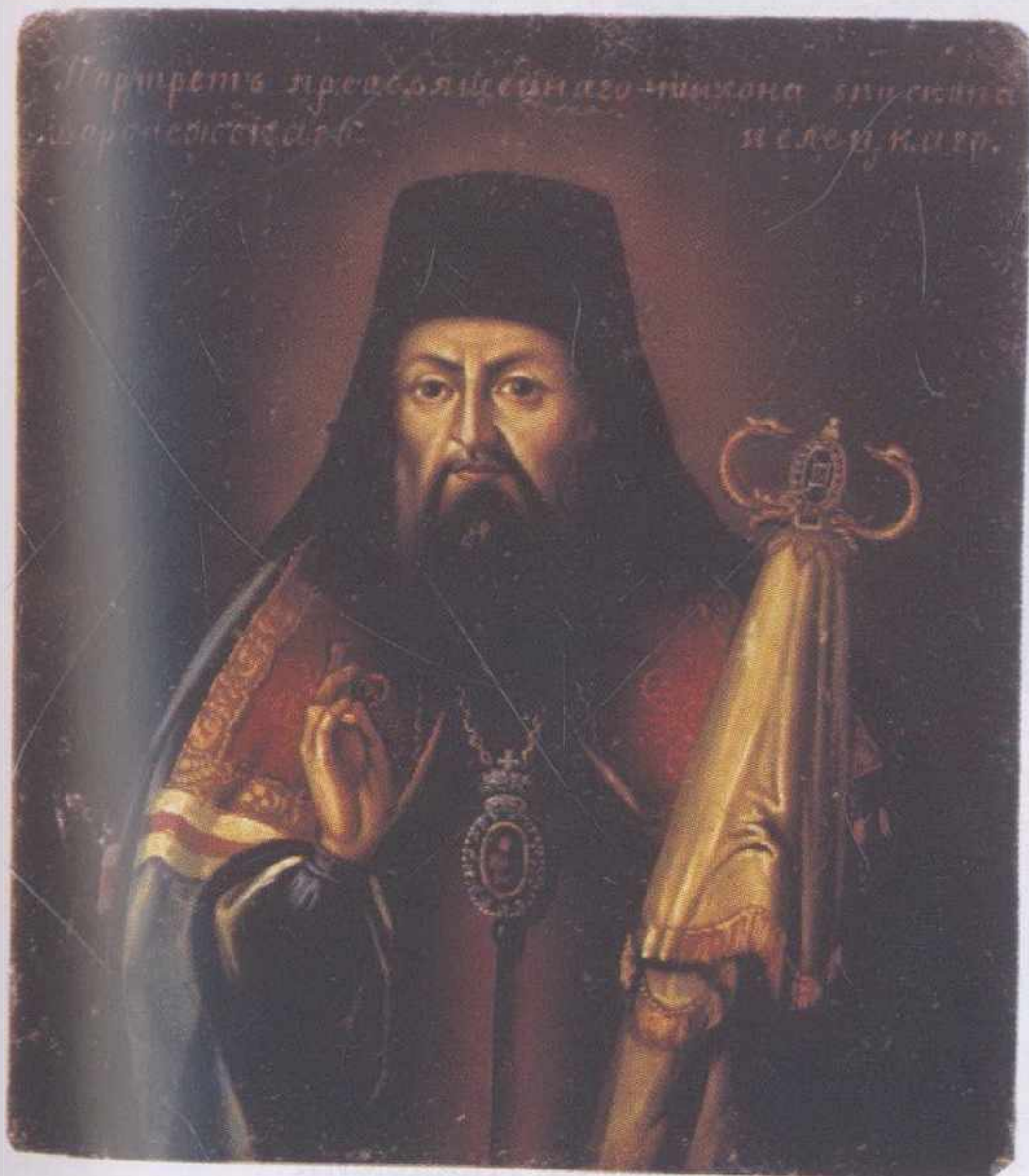
Портрет святителя Тихона Задонского. Первая половина XIX в. Неизвестный художник. Государственный исторический музей