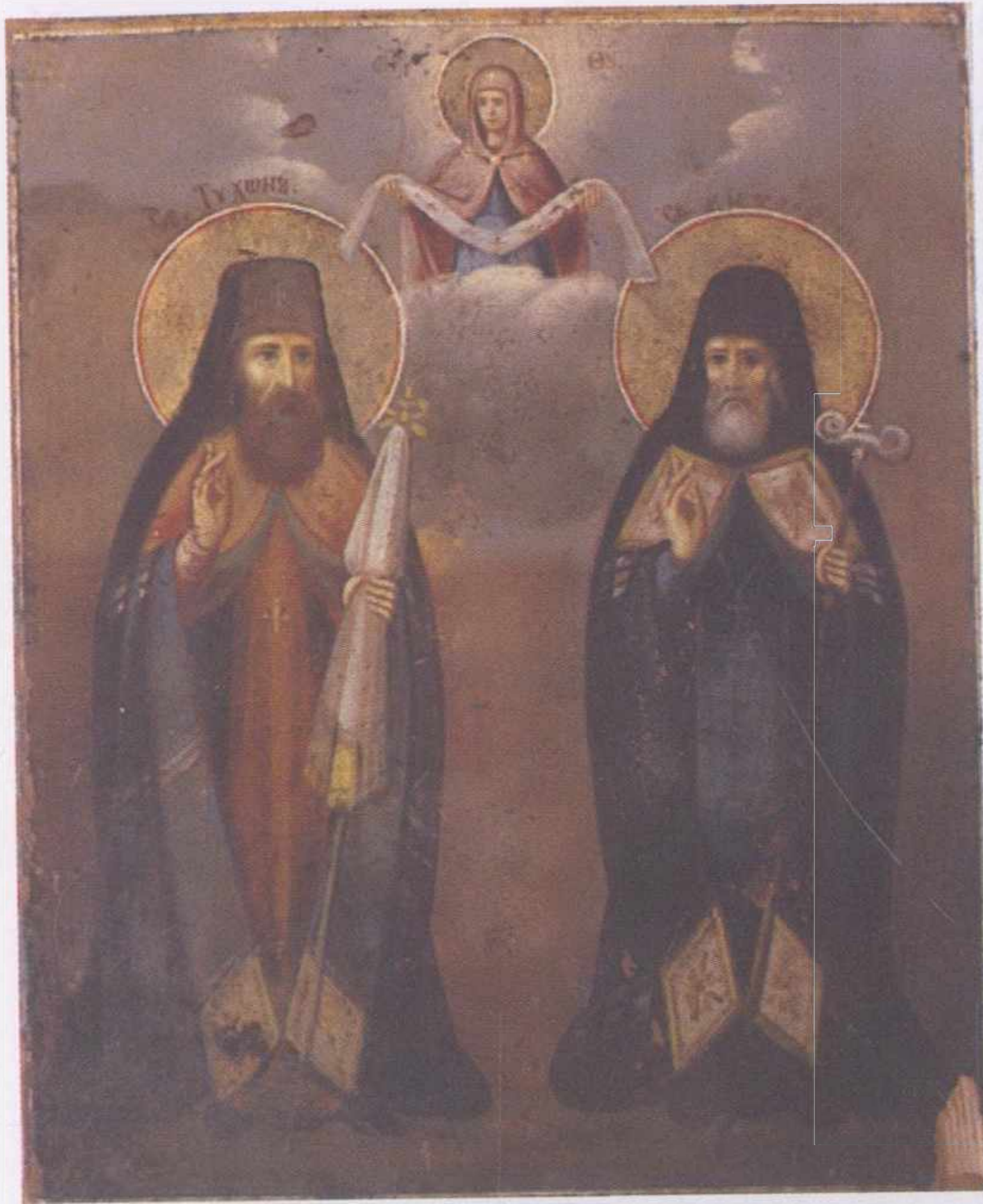
Икона святителей Тихона Задонского и Митрофана Воронеж- ского.