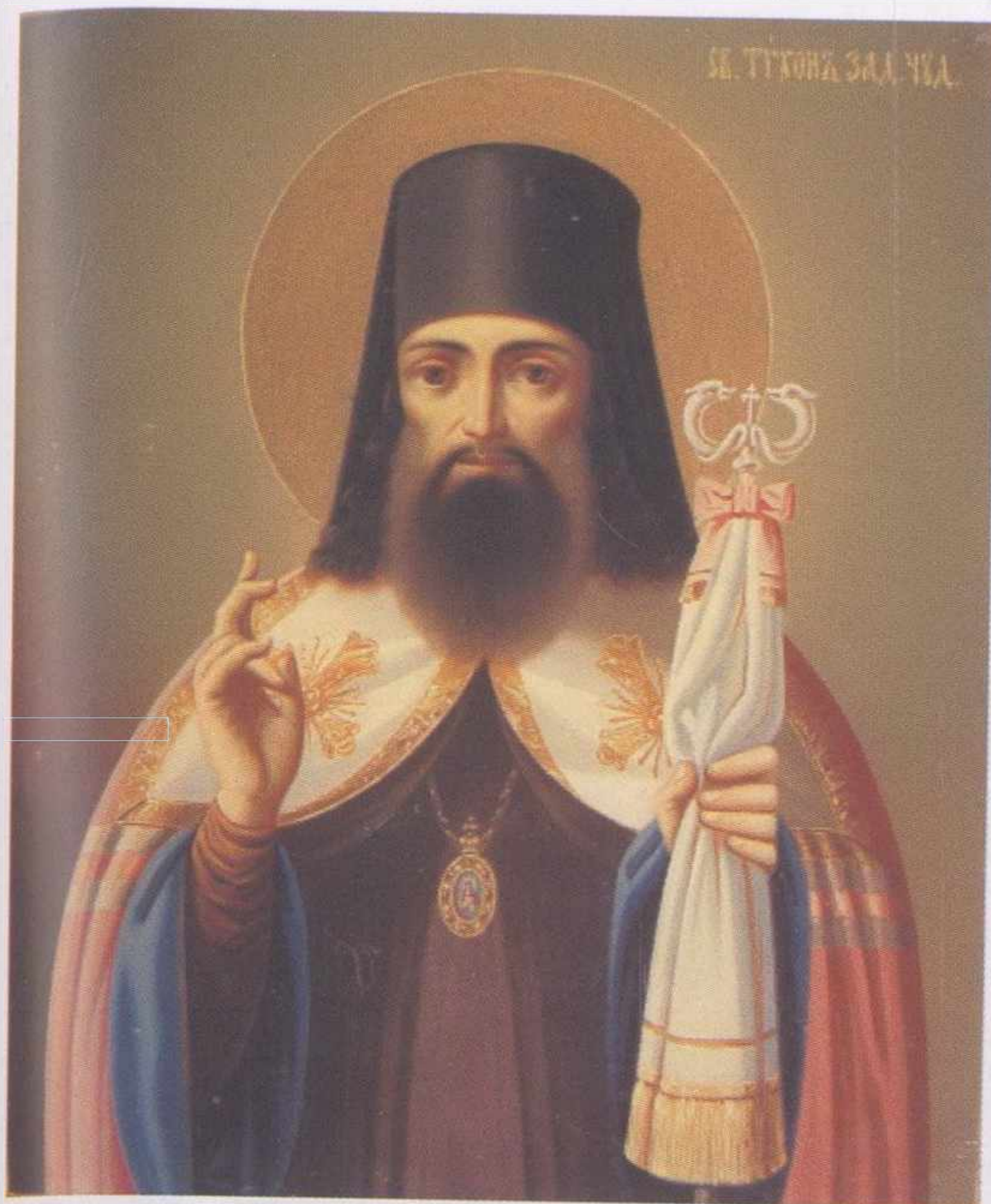
Икона святителя Тихона Задонского. Последняя треть XIX в. Ризница Троице- Сергиевой лавры