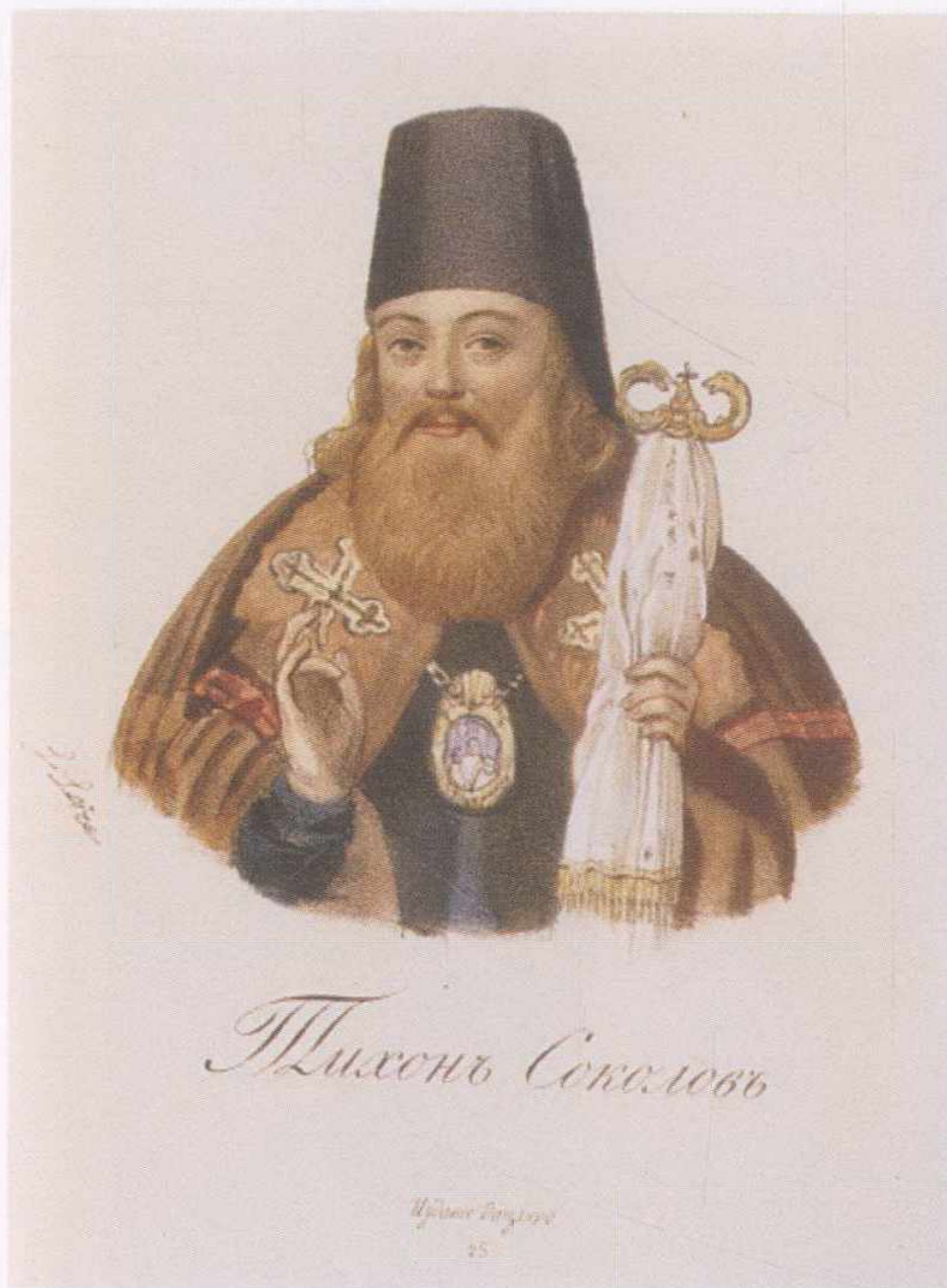
Портрет святителя Тихона Задонского. Середина XIX века. Литограф Л. Лорис. Издание И.Х. Дациаро. Санкт- Петербург. Церковно- археологический кабинет Московской Православной Духовной Академии