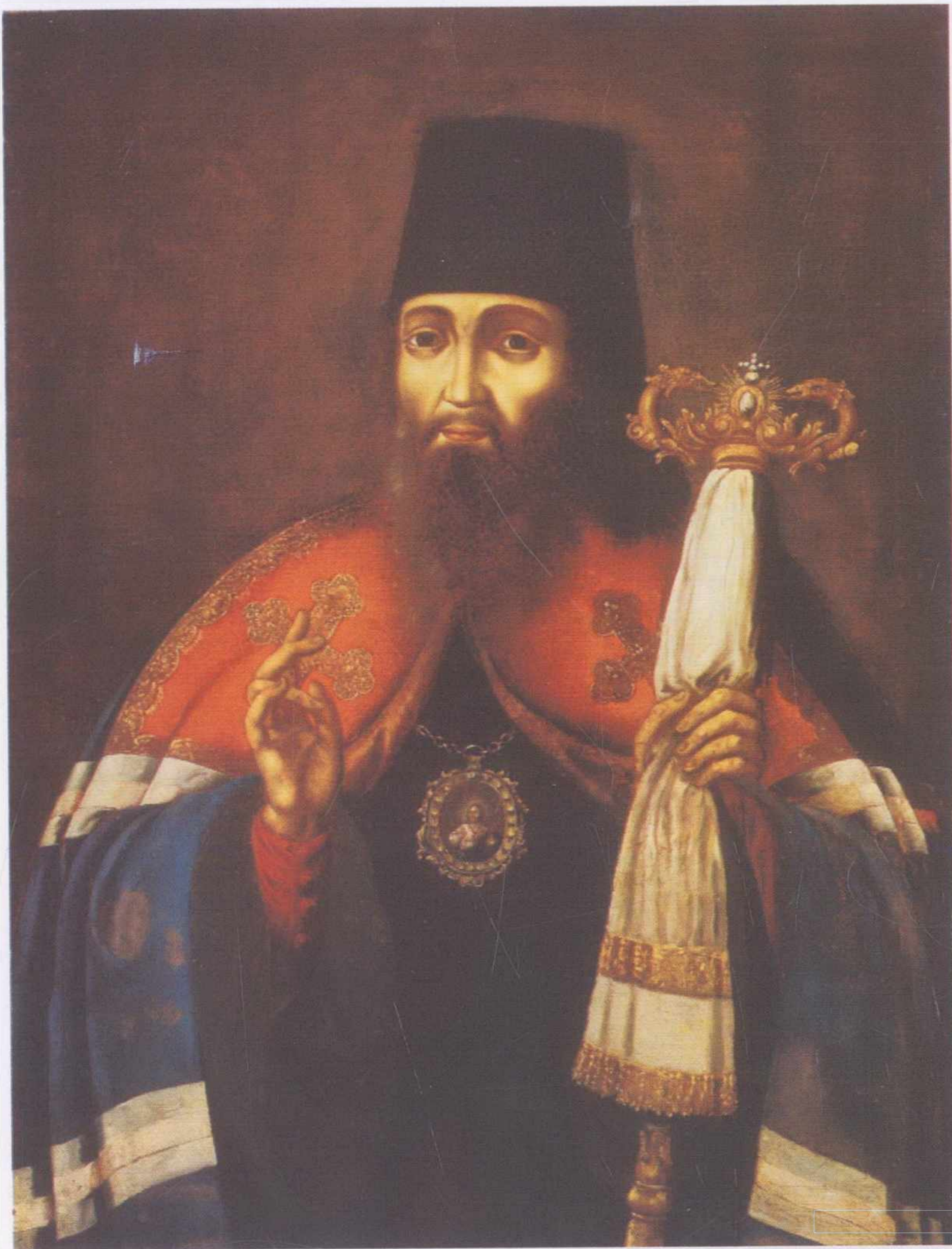
Портрет святителя Тихона Задонского. Последняя треть XVIII в. Неизвестный художник. Церковно-археологический кабинет Московской Православной Духовной Академии