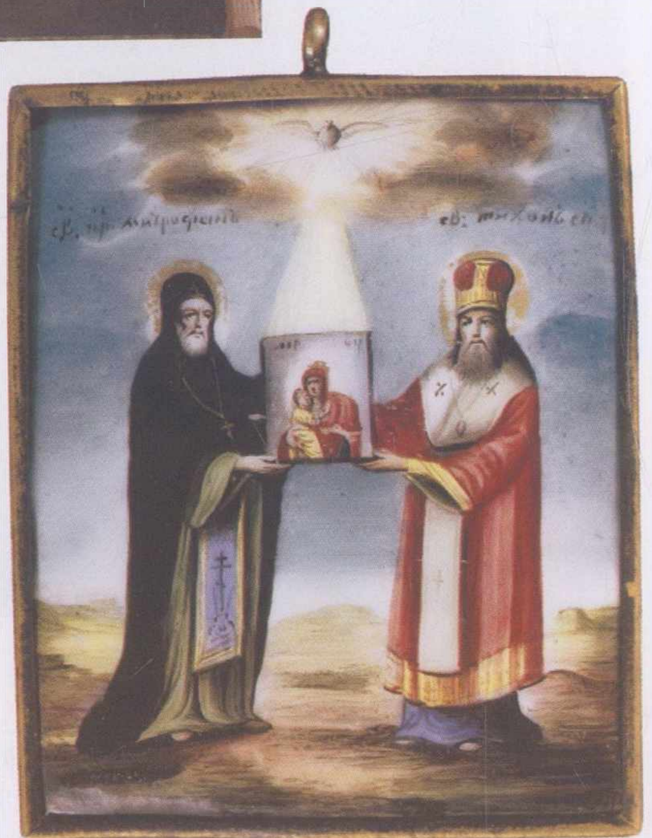
Икона святителей Мит- рофана Воронежского и Тихона Задонского. Вторая пол. XIX в. Ростов. Центральнй му- зей древнерусской культуры и искусства имени Андрея Рублева