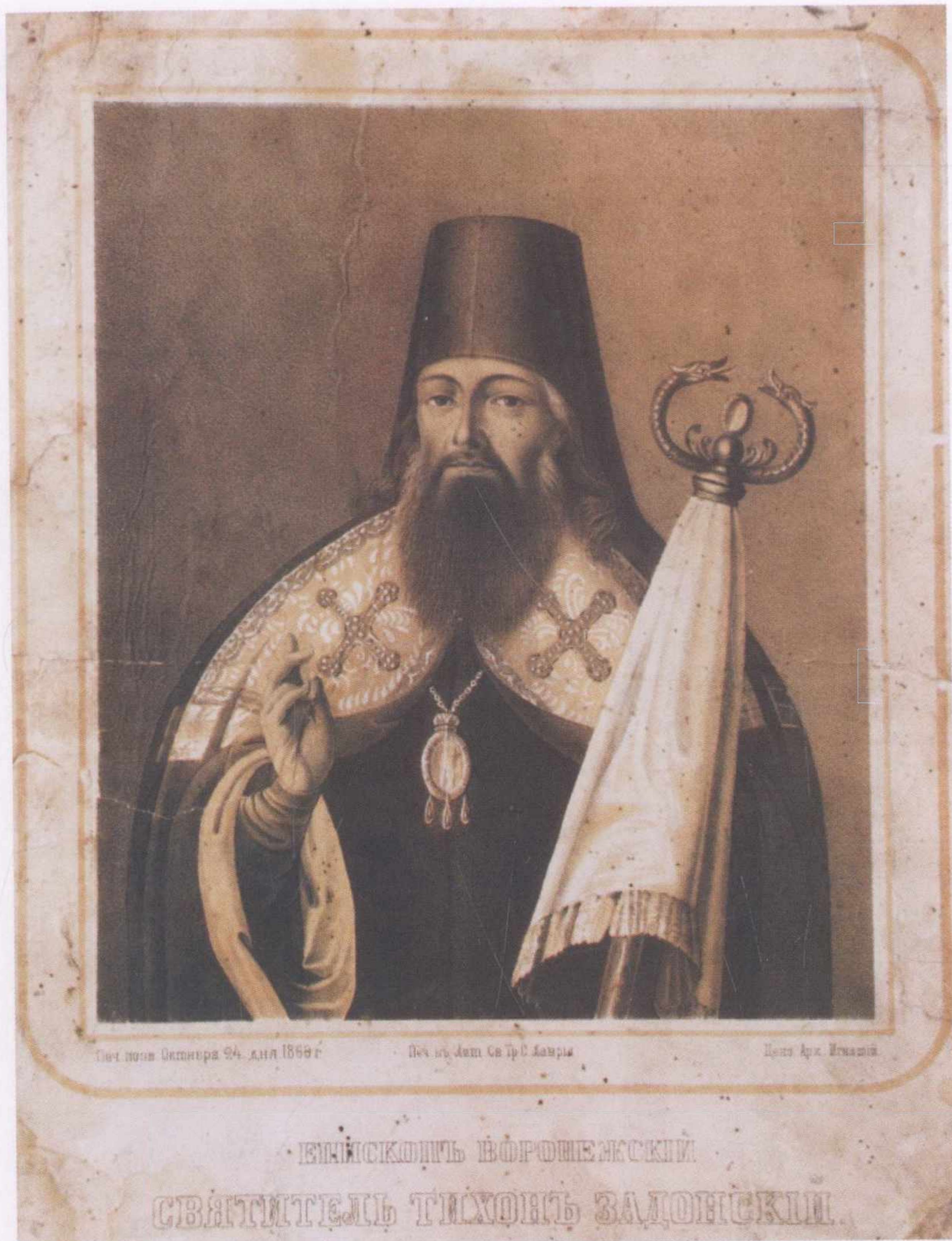
Портрет святителя Тихона Задонского. 1860 г. Литографская мастерская Троице-Сергиевой Лавры. Церковно-археологический кабинет Московской Православной Духовной Академии