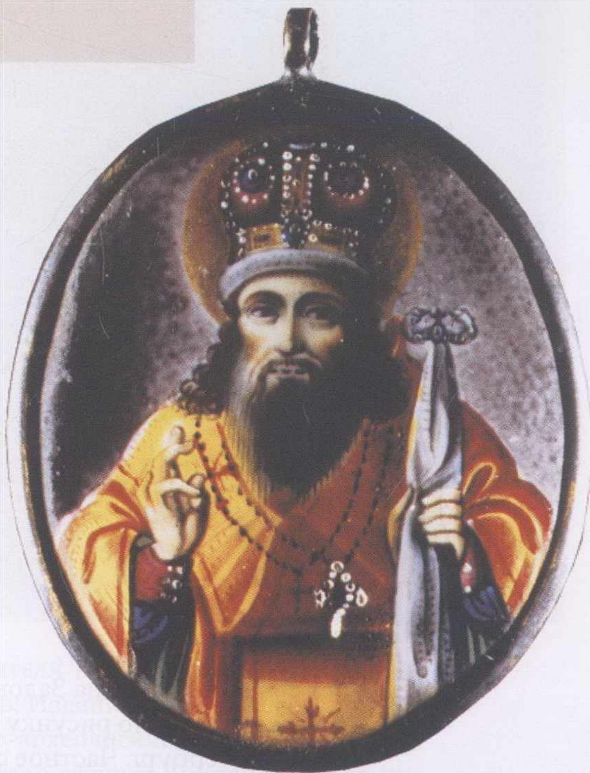
Икона святителя Тихона Задонского. Вторая пол. XIX в. Ростов. Церковно-археологиче- ский кабинет Московской Православной Духовной Академии