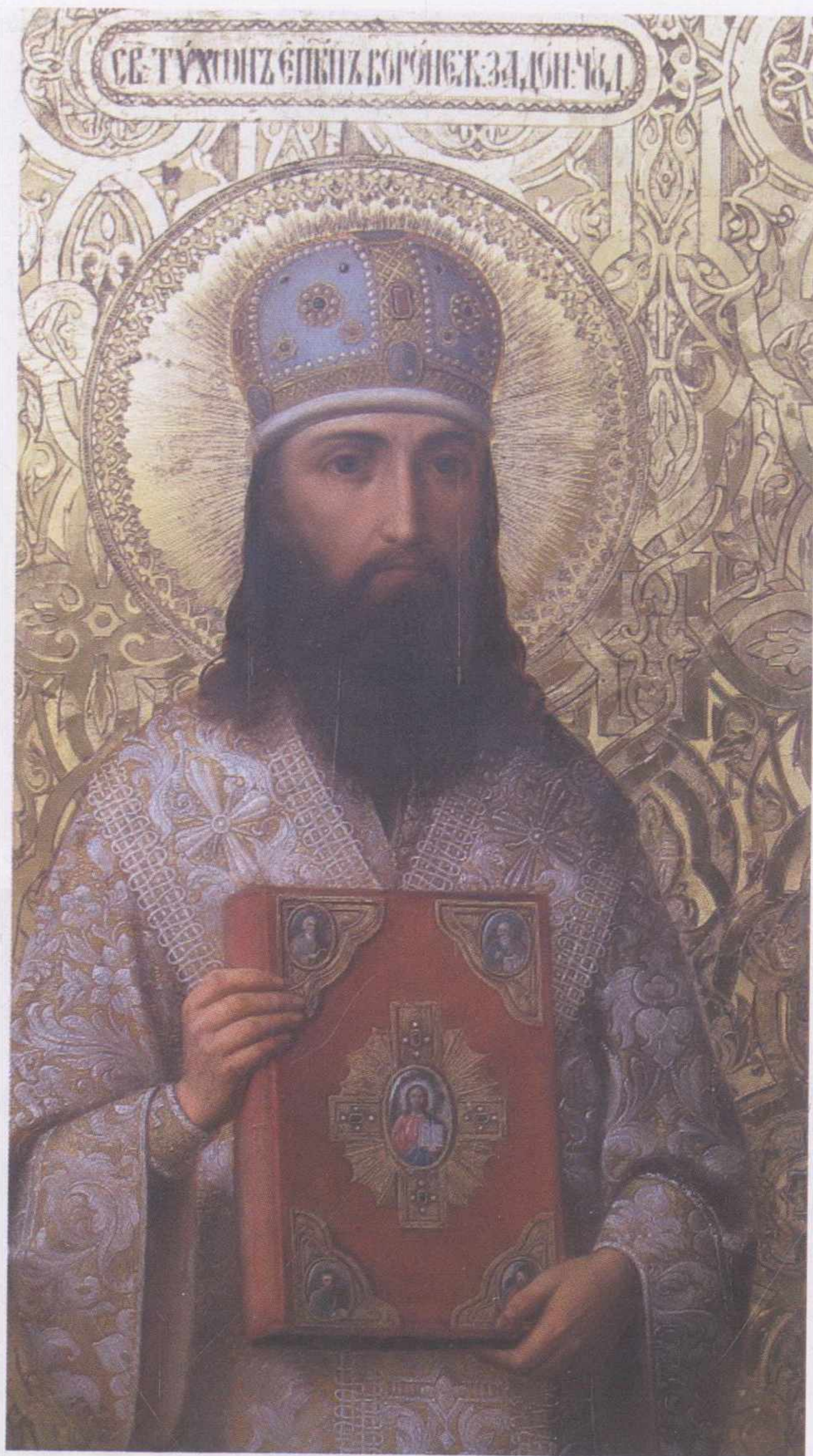
Образ святителя Тихона Задонского. Фрагмент иконы святителей Митрофана Воронежского и Тихона Задонского. 1888 г. Мастерская Малышева в Сергиевом Посаде. Частное собрание